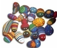
Figura 1. Resultado de la actividad “Trabajamos la creatividad”.