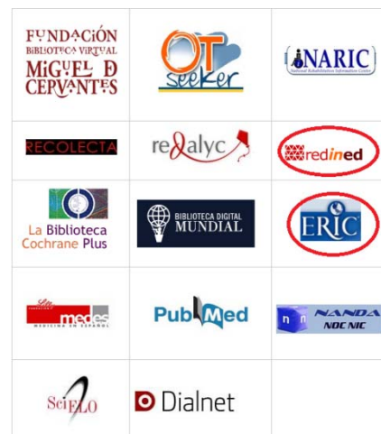
Figura 2. Bases de datos de acceso

Una de las bases de datos más conocidas y que presenta muchas ventajas para los estudiantes es Google Académico 3 , ya que es una base de acceso libre que