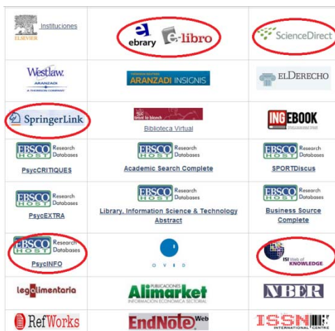
Figura 1. Bases de datos acceso UCAM

En las Figuras 1 y 2 aparecen rodeadas con un círculo las bases de datos 2 más útiles para el área de Educación que se encuentran en la página de la Biblioteca Digital de la UCAM.