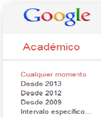
Figura 4. Delimitar la fecha de Búsqueda

Podemos indicar a partir de qué fecha queremos obtener los documentos, así como un intervalo de años específico (Figura 4). Esta herramienta es muy útil ya que es importante que la literatura utilizada para nuestro trabajo sea reciente y actualizada.